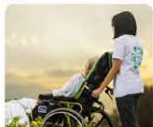
ASYSTENT OSOBY NIEPEŁNOSPRAWNEJ