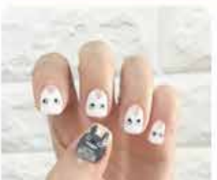
TECHNIK USŁUG KOSMETYCZNYCH