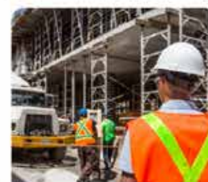
TECHNIK BHP NOWOŚĆ