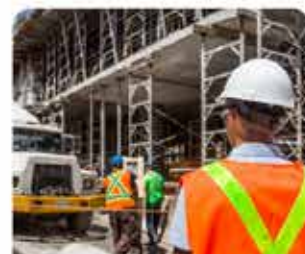
TECHNIK BHP NOWOŚĆ