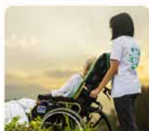
ASYSTENT OSOBY NIEPEŁNOSPRAWNEJ