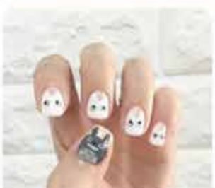
TECHNIK USŁUG KOSMETYCZNYCH